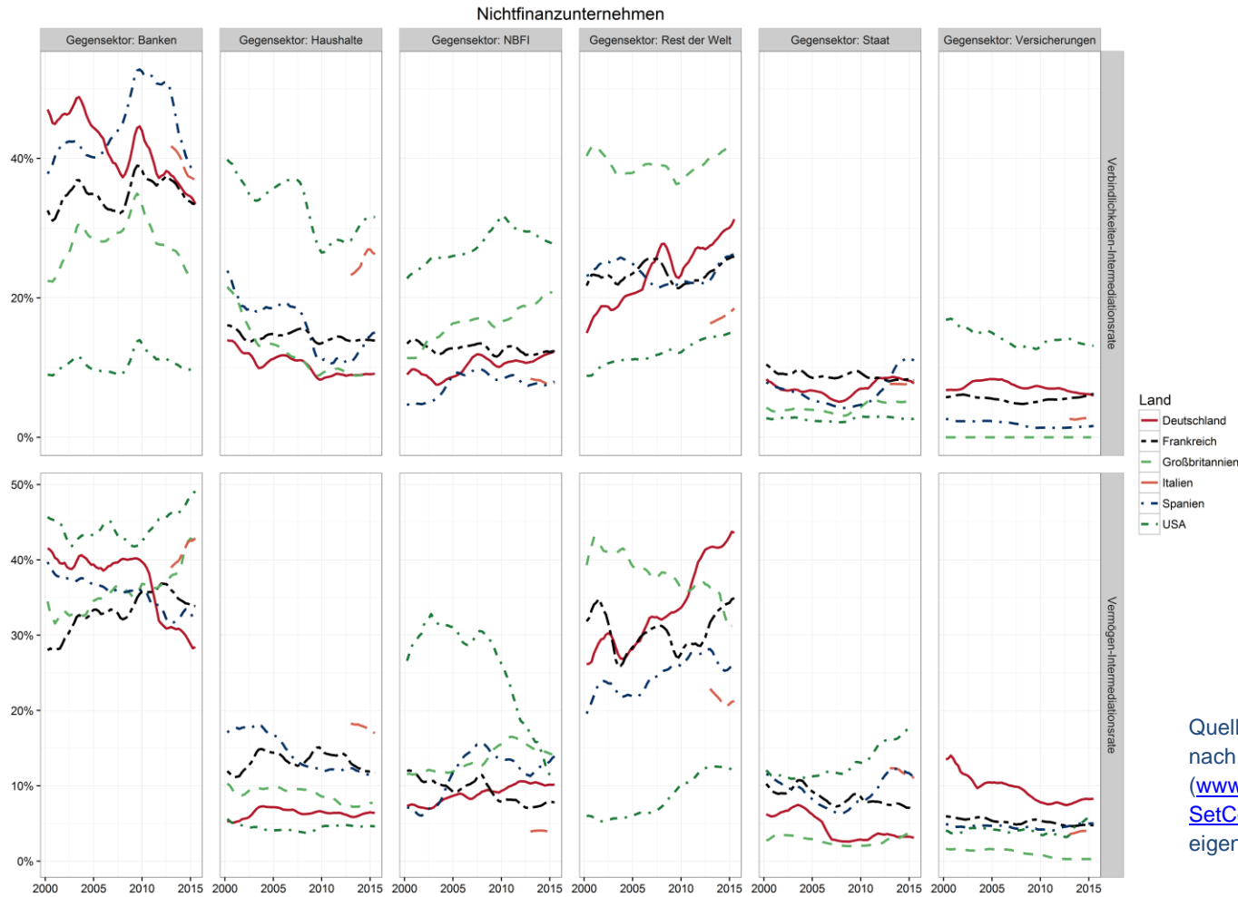
Online-Abbildung 5.2: Alle Intermediationsraten der Nichtfinanzunternehmen